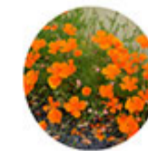
Pavot de Californie Escholtzia californica Floraison : mars-juin Exposition : ensoleillée Rusticité : forte